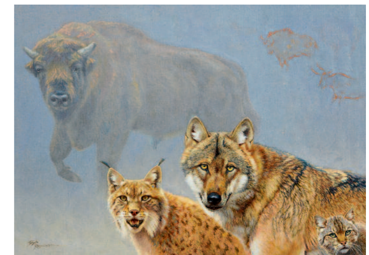
Rückkehrer, Öl auf Leinwand, 80 x 100 cm

kleinen Vogel darin, dessen lateinischer Gattungsname dem Bild den Namen gab. Der ungewöhnliche Titel verrät nicht sofort das Hauptmotiv, denn wir sollen es selber finden, sollen das Gegengewicht, diesen kleinen, aber doch in der Bildkomposition so gewichtigen Akzent im Bild entdecken, der in der Lage ist, das so große Gewicht im oberen Bildteil kompositorisch auszubalancieren.