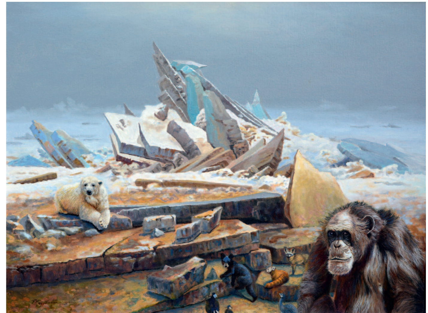
Erderwärmung nach Casper David Friedrich, Öl auf Leinwand, 60 x 80 cm